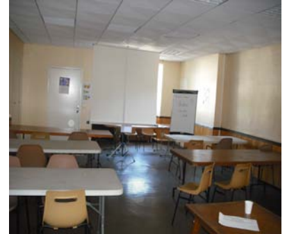
Salle de travail